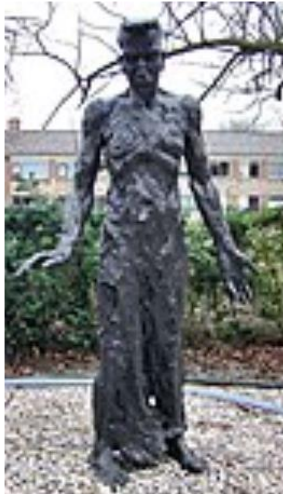
Titus Brandsma Bonifacius Kapel Dokkum

Mystiek leven een bloemlezing, spiritualiteit, blz. 38.