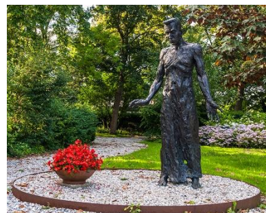
Beeld van Titus Brandsma bij Bonifatiuskapel in Dokkum

Uit: Van Titus Brandsma tot Edith Stein, blz. 140, Adveniat,