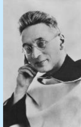
Heilige Titus Brandsma