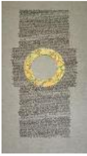
Gekalligrafeerde Karmelregel door Arie Trum