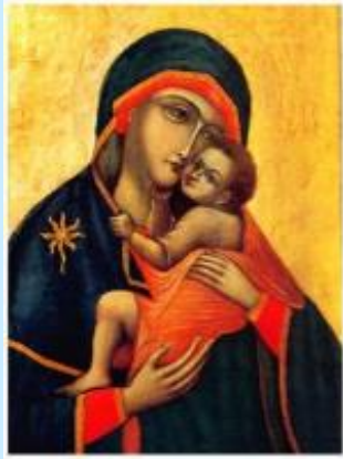
Maria, Onze Lieve Vrouw van de berg Karmel