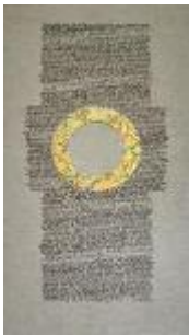
Gekalligrafeerde Karmelregel door Arie Trum